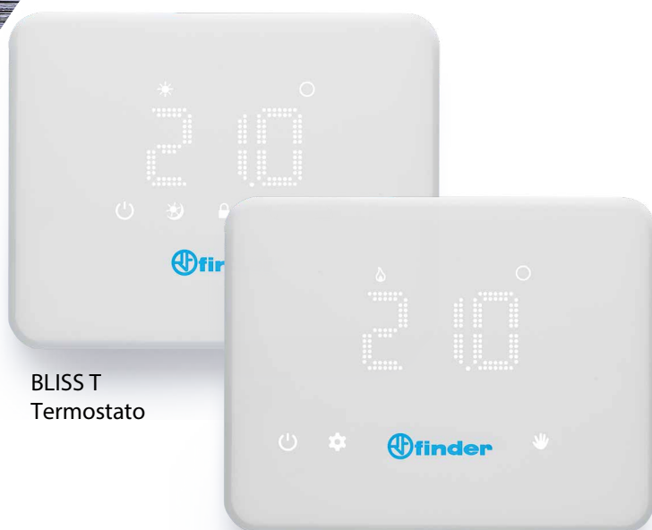
BLISS T Termostato